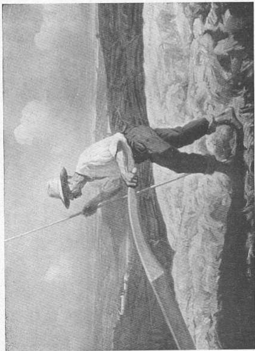
LE LABEUR DER ARBEIT